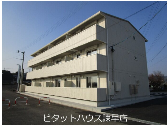
ピタットハウス諫早店